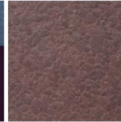
Boden: Gummigranulat „violett“