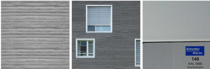
Gebäudesockel: Beton mit Brettschalung