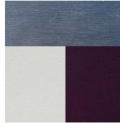
Wände und Decke: Kunstharz weiss und violett, Chromstahl gebürstet