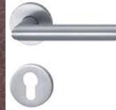
Türdrücker, Edelstahl matt