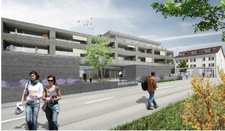
Westfassade, Ansicht von Egliswilerstrasse her