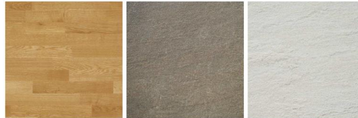
Bodenbelag Wohnen: Parkett versiegelt