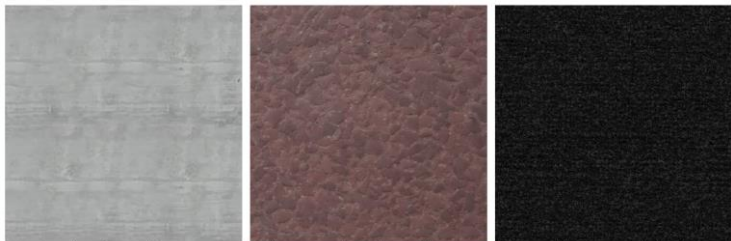
Wände und Decke: Sichtbeton